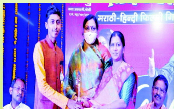
Vidharbh Level Singing Competition