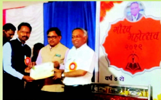
Pratibha Gaurav Award