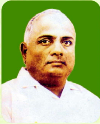
Late J. D. Patil alias Babasaheb Sangludkar

First Union Minister of Agriculture, Govt. of India