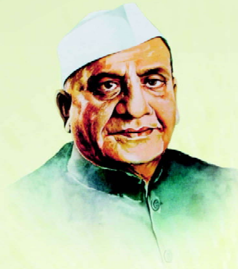
Late Dr. Panjabrao alias Bhausaheb Deshmukh Founder President

Shri Shivaji Education Society, Amravati