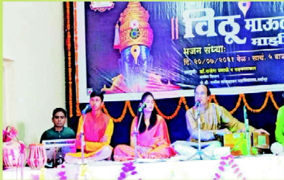
Vithu Mauli Programme