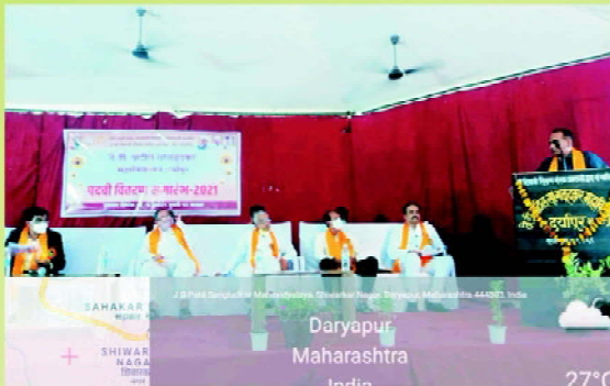
Padvi Vitaran Samarambh