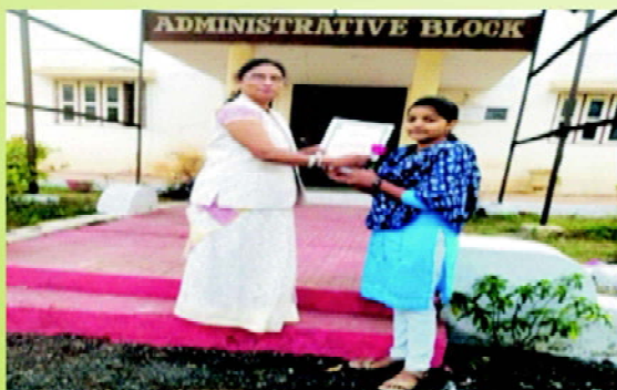
Debate Competition Award