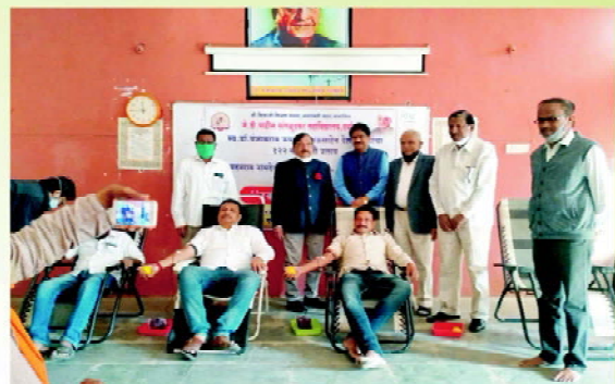
NSS Blood Donation Camp