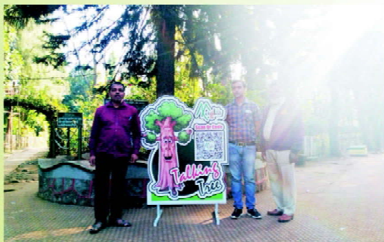
Talking Tree at Melghat Tiger Project