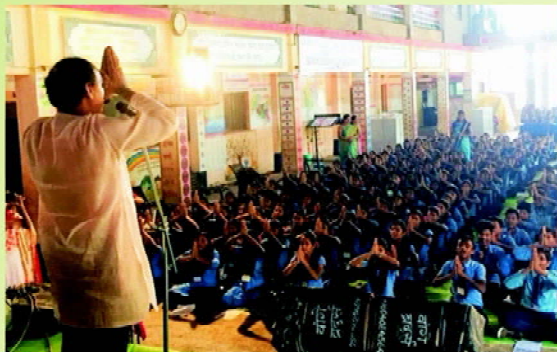
Sa, Re, Sa, Re Gau Ya