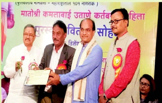
State Level Seva Award