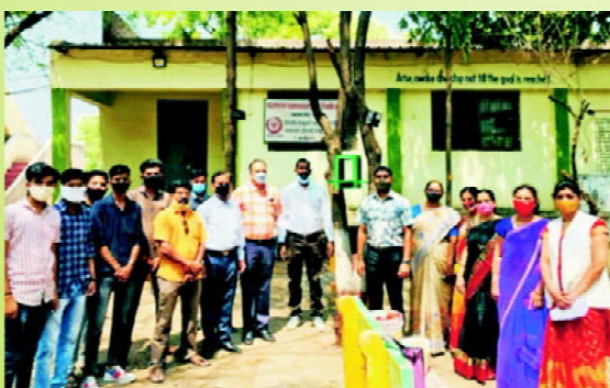
World Sparrow Day