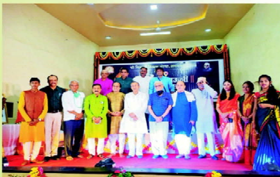
Vithu Mauli Programme