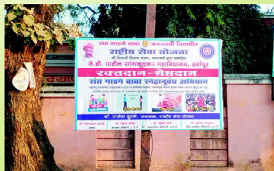
Blood Donation Drive